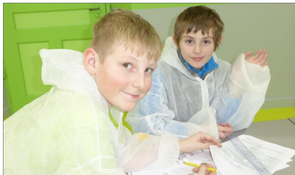
Les enfants ont pu découvrir les méthodes de la police scientifique à partir d'une scène de crime, (extraction de l'ADN, trouver sa taille à partir des empreintes de chaussures...).

Pour cette première semaine de vacances, c'est la science qui est à l'honneur au service jeunesse, dans la perspective de préparer le festival Parc 0 Sciences qui aura lieu en juillet.