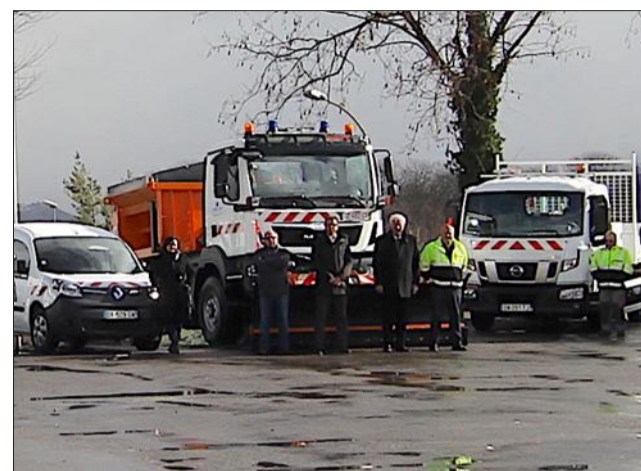
Élus, cadres et agents ont posé devant les véhicules neufs.